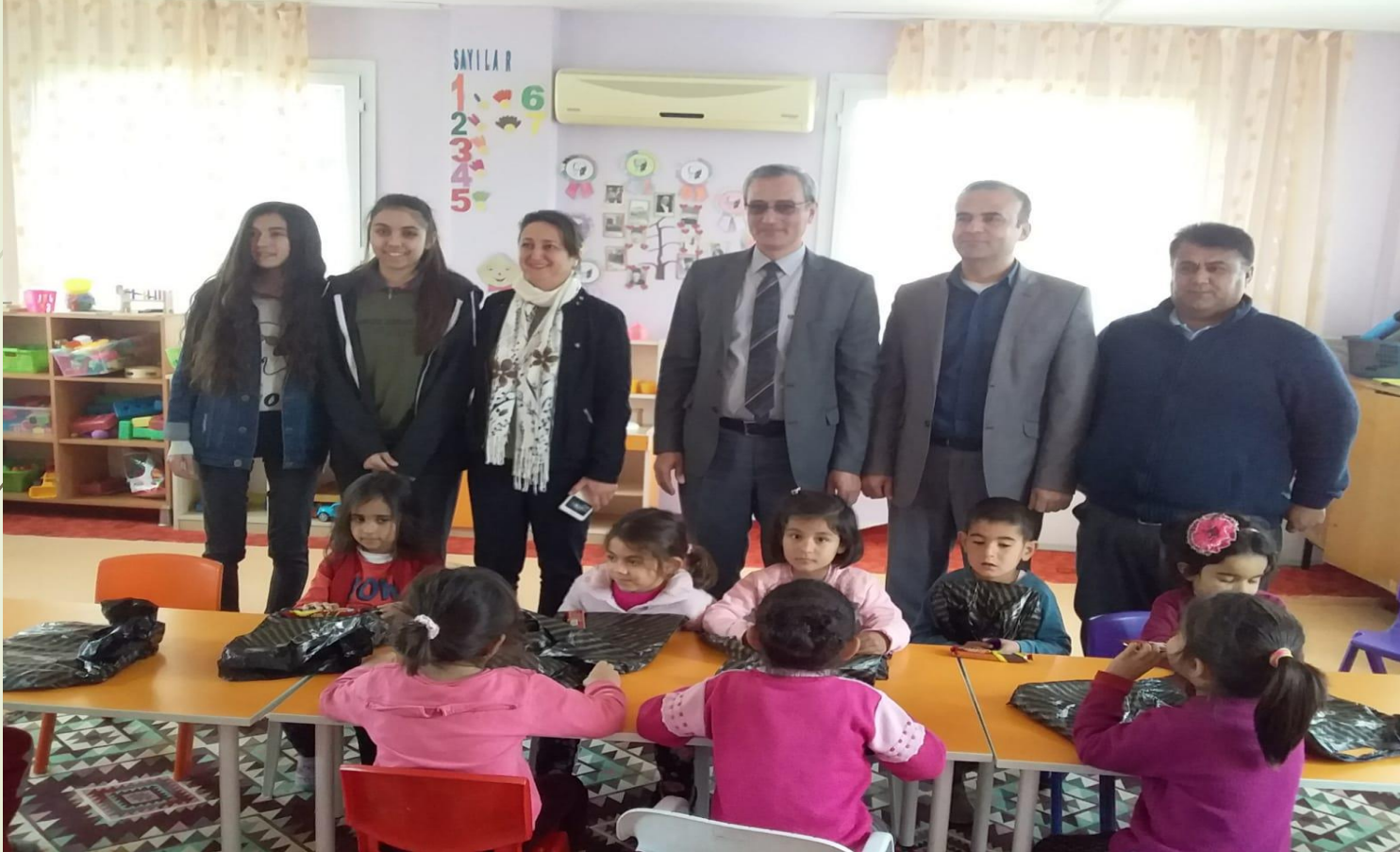
Kardeş okul ziyareti