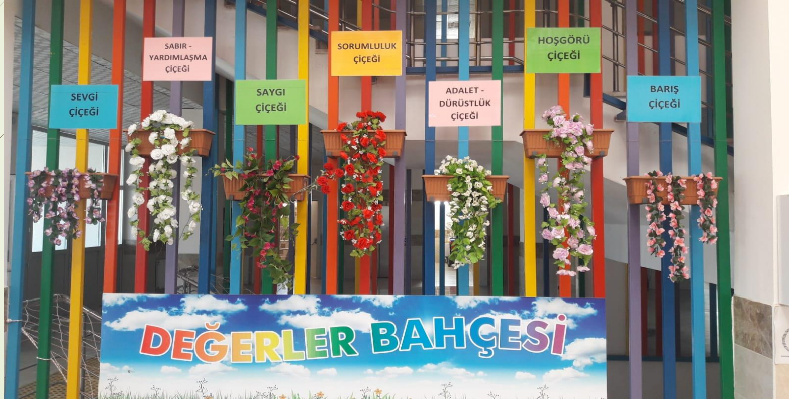
Değerler eğitimi köşesi

2 - Öğrencilerimizde “Değerler eğitimi” kapsamında köşeler oluşturulmuş olup bu konuda gerekli hassasiyetler gösterilerek önemli adımlar atılmıştır.