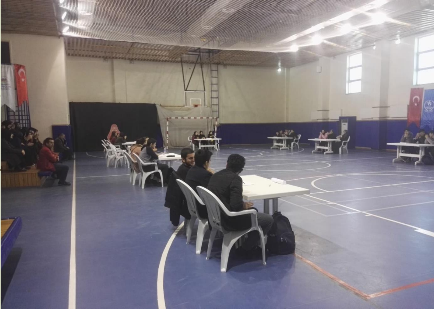
Sınıflar arası bilgi yarışması