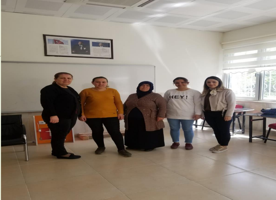
Özel eğitim veli toplantısı

1- Özel eğitim öğrencilerinin velilerine eğitim çalışmalarının yapılması.