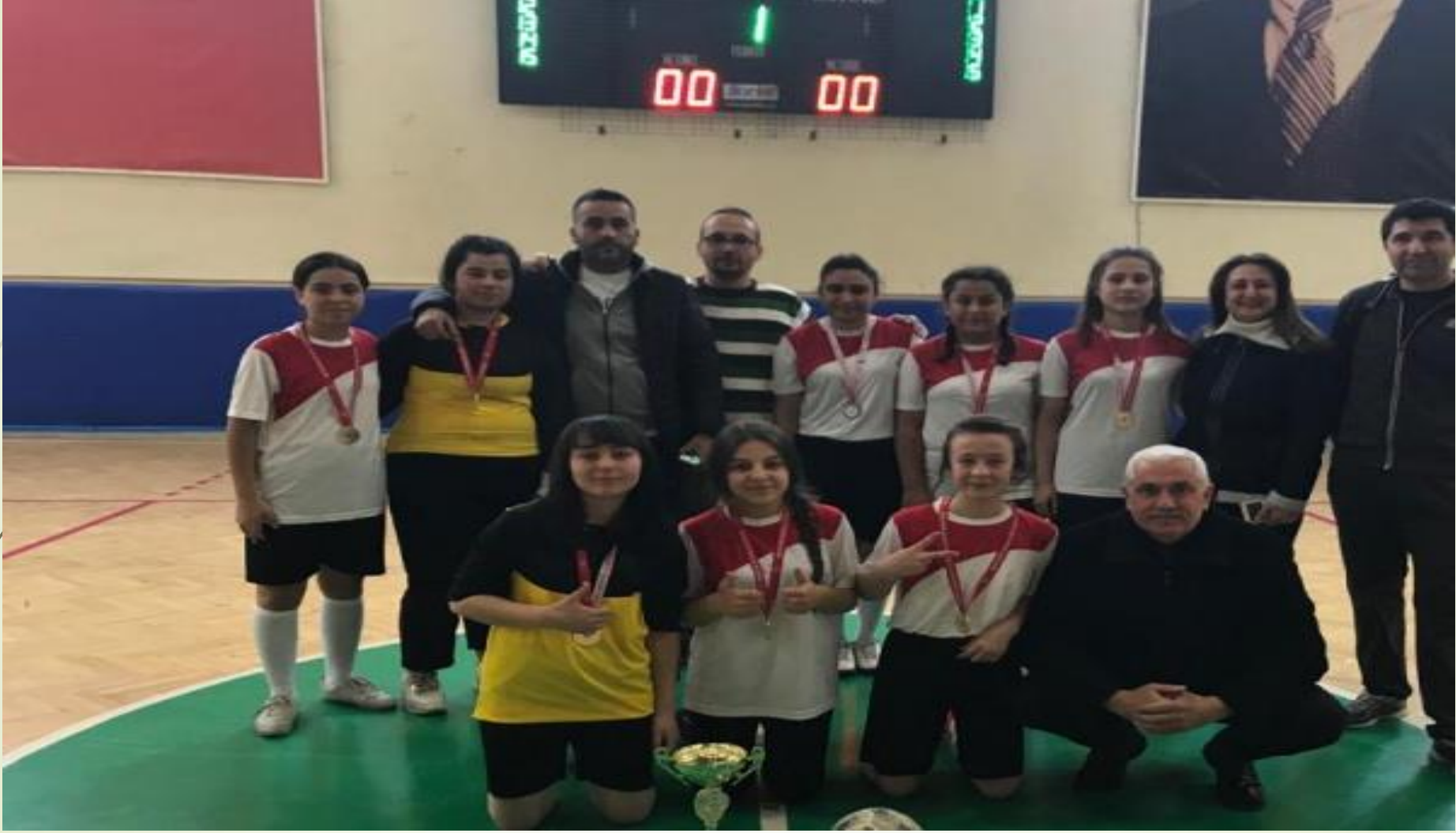
Okul sporları futsal genç kızlar il birinciliği