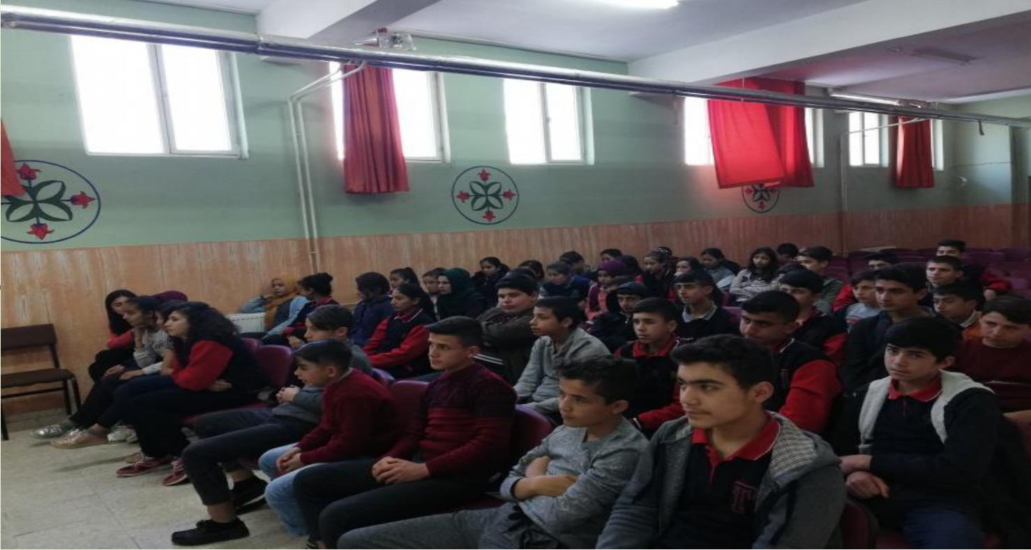
Kariyer günleri semineri

1- 8. Sınıf öğrencilerine Kariyer Planlaması portalı tanıtıldı ve KARIYER GÜNLERİ kapsamında dış hekimi , banka müfettişi ve psikolog okulumuza davet edildi; öğrencilere seminer verildi.