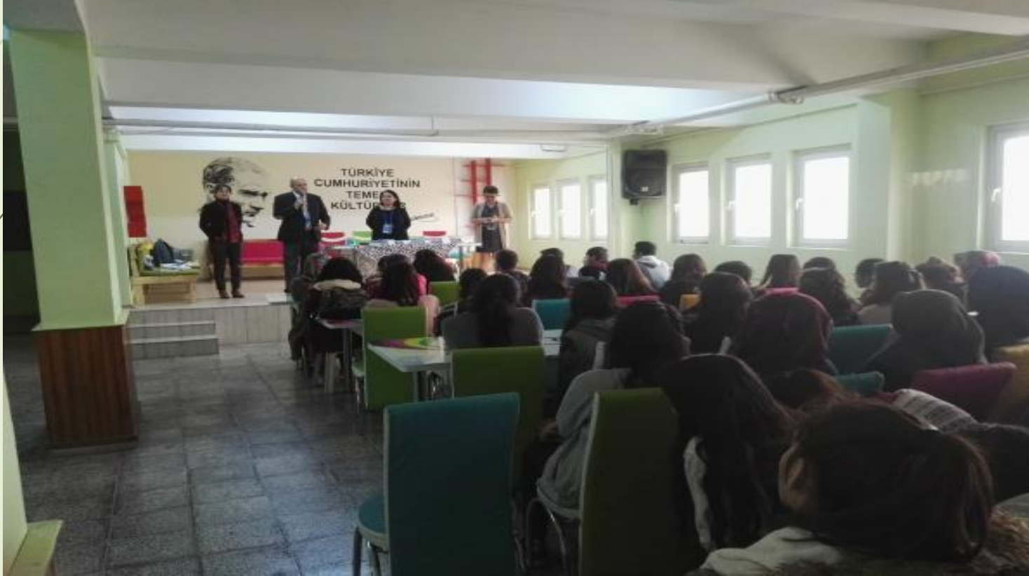
Kariyer günleri semineri