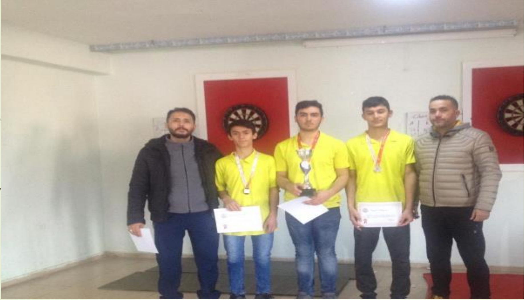
Osmaniye okul sporları tenis genç erkekler il birinciliđi