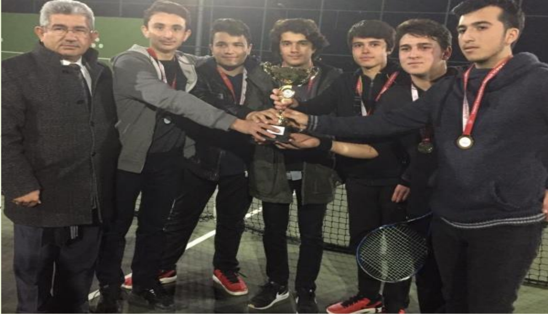
Okul sporları masa tenisi genç erkekler il birinciliđi