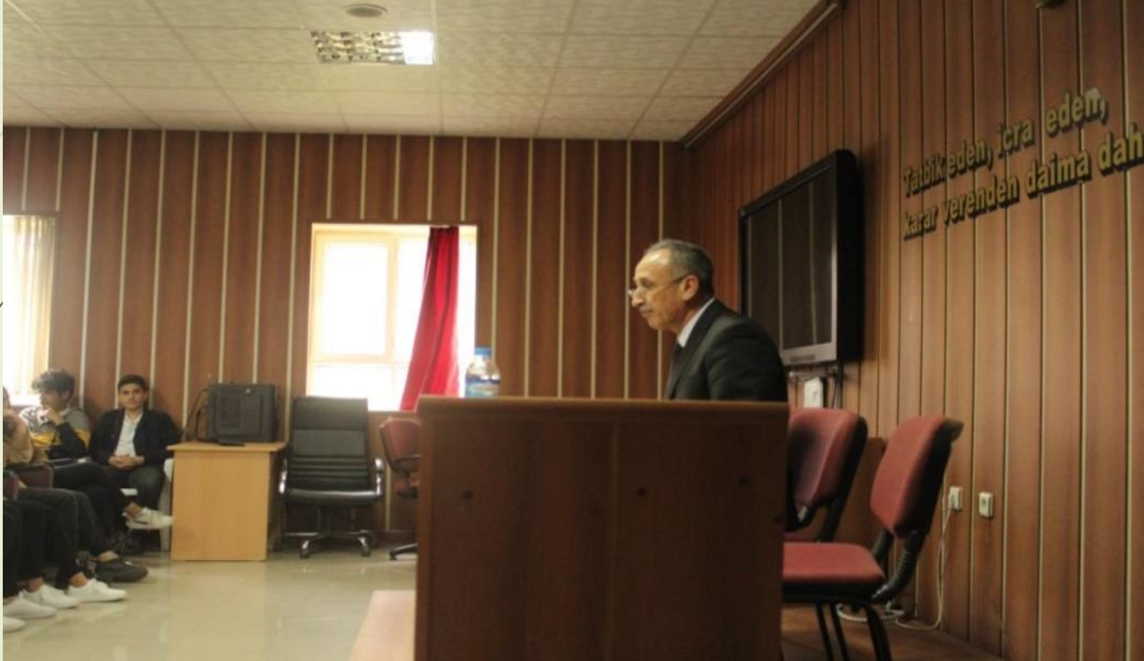
Değerler eğitimi kapsamında seminer