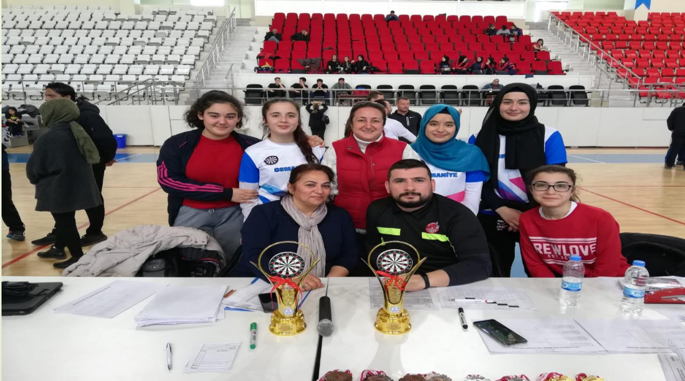
Genç kızlar Dart Türkiye finalleri il birinciliği

1 -Dart Takımını okul sporları müsabakalarını hazırlık amacı ile Osmaniye Belediyesinin düzenlemiş olduğu kurtuluş kupası organizasyonuna dart erkek kız yıldız takımı olarak katılım yapılmıştır ve her iki kategoride de takım olarak il birincisi olmuştur.