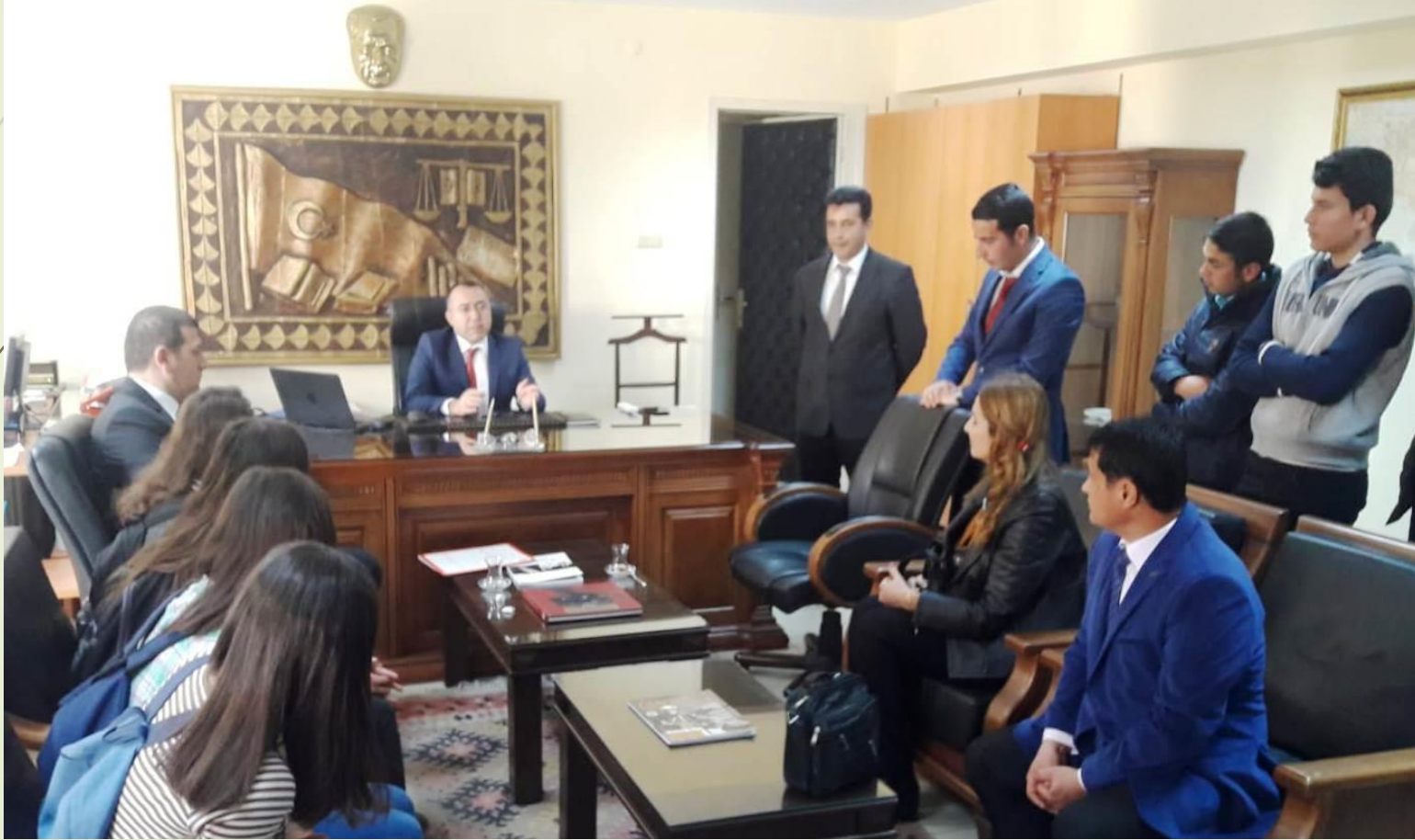
Rehberlik amaçlı işletmeler ziyareti