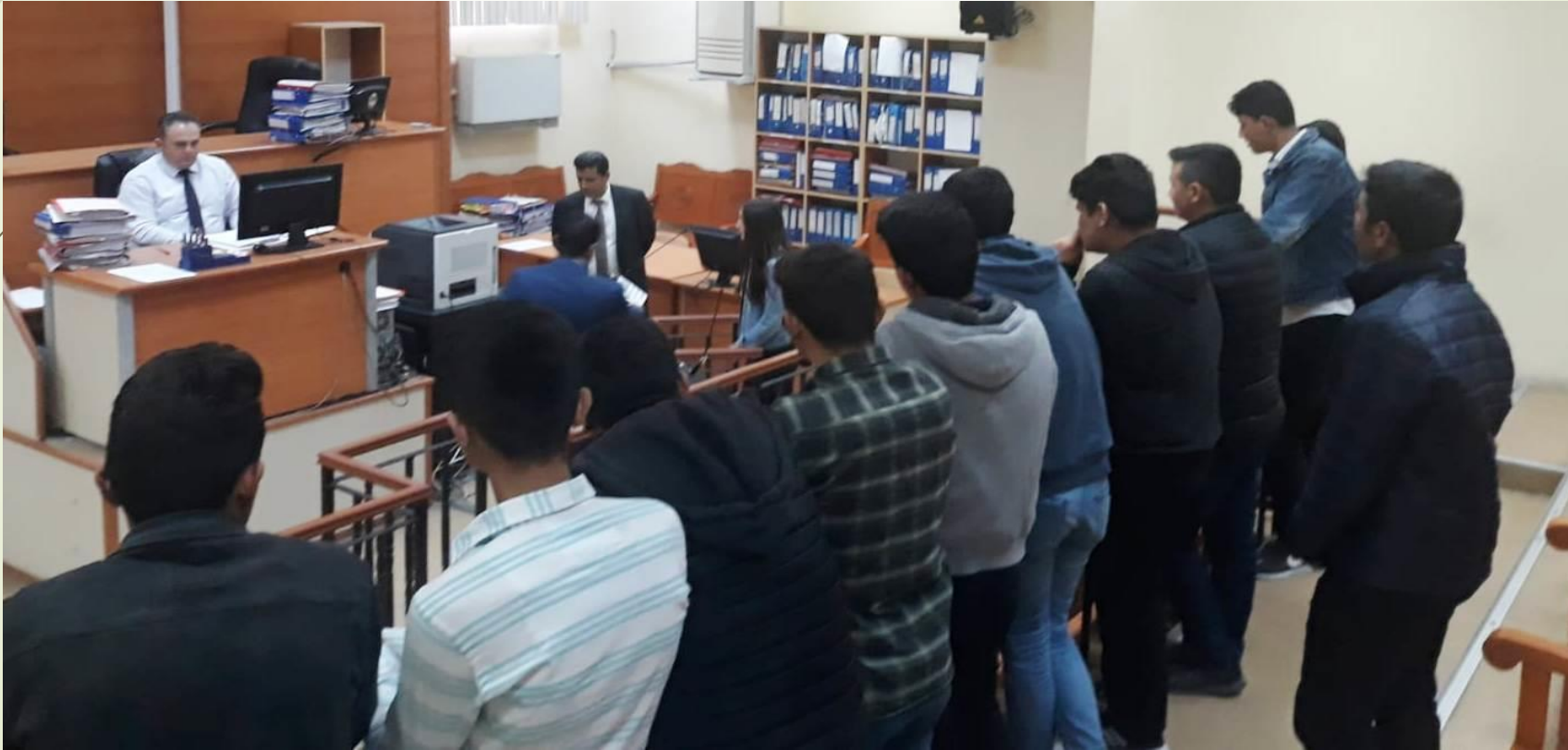
Hayatım Mesleğim Projesi

1- Milli Eğitim Bakanlığınca oluşturulan “Hayatım Mesleğim” konulu proje kapsamında meslek tanıtımı yapılmıştır.