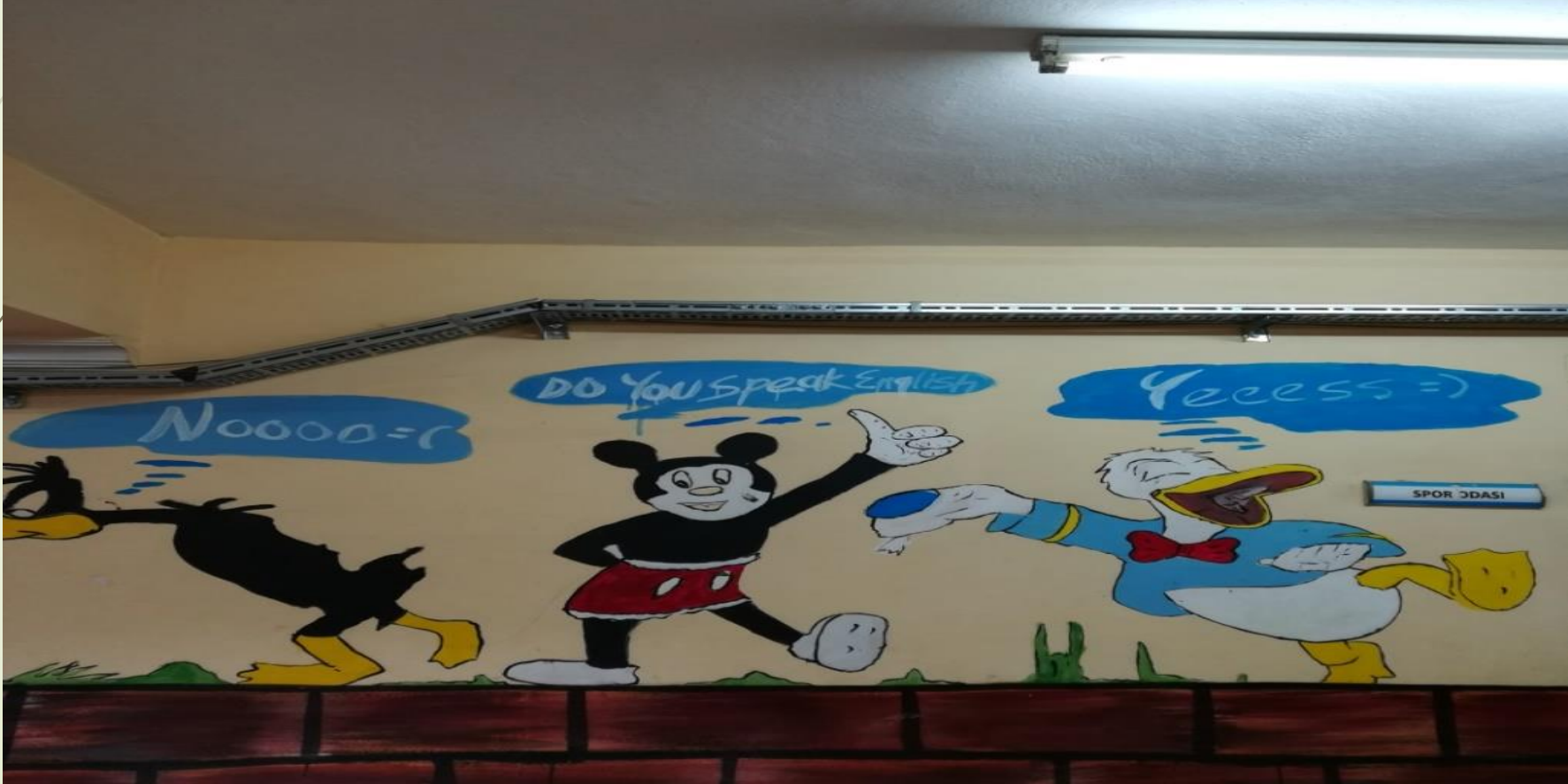
İngilizce sokağı pano çalışması

1- Yabancı Dil Öğretmenlerimizin Seminer ve Mesleki Eğitimlere katılımları teşvik edilerek, okullarda İngilizce Sokağı ve Pano çalışmaları yapılmıştır.